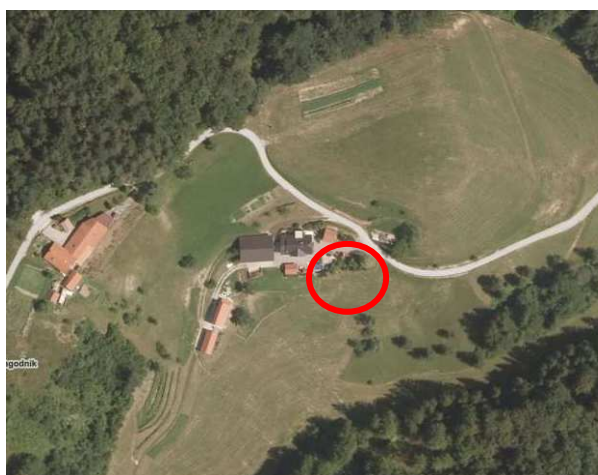
Slika 3: širši prikaz v prostoru – digitalni ortofoto posnetek