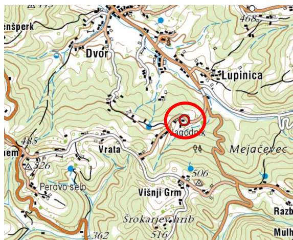
Slika 2: širši prikaz v prostoru – topografija (vir: www.geopedia.si )